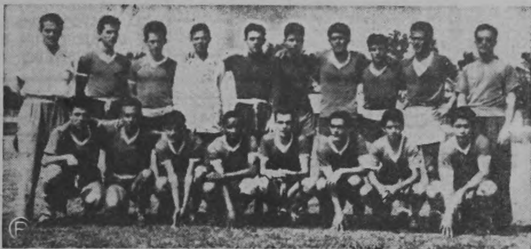
La Selección Juvenil de Costa Rica debutará esta noche en la gramilla del Estadio Olímpico salvadoreño frente a la pesada y vigorosa escuadra de Curazao. Será una prueba determinante no obstante ser la primera, porque de ella dependerá casi totalmente nuestras posibilidades. Los morenos antillanos debutaron el domingo goleando a Honduras y demostrando una superioridad tremenda con base en su contextura física. Los nuestros han entrenado muy bien pero no se sabe si la diferencia de estatura y de peso pueden ser decisivas a la hora de las acciones. El resultado es esperado con enorme interés por toda la fanaticada. El juego dará comienzo a las seis y treinta de la tarde y será retransmitido por Radio Crystal.

Muy pronto podremos apreciar todos los frutos que nos va a dejar el presente torneo. Felicitamos al Faerrón por su brillante labor cumplida durante la celebración del torneo a instancias de sus muchachas para que sigan adelante, que muy pronto llegarán los triunfos.