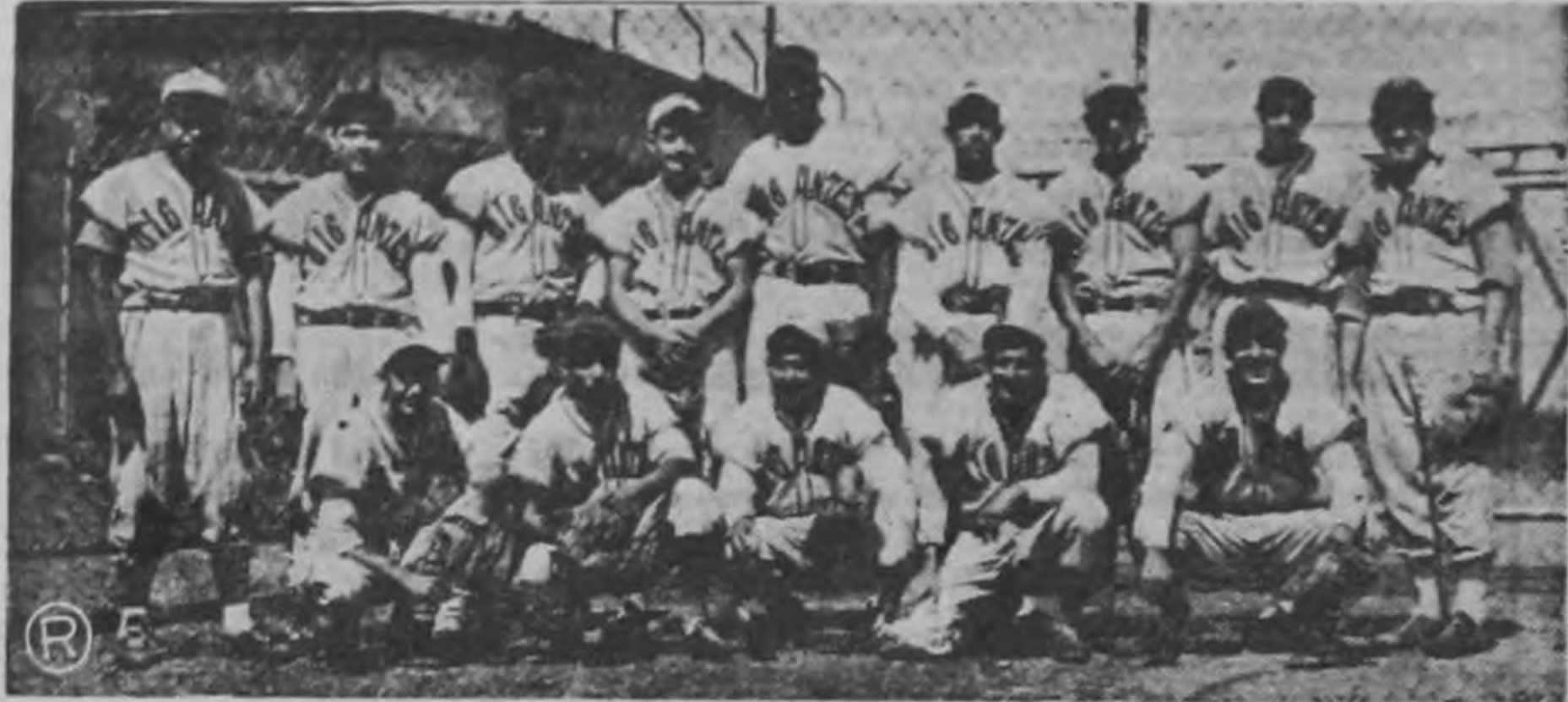
Aquí está la novena Gigantes posando para nuestra sección deportiva, minutos antes de empezar el juego estelar del domingo en el Parque Antonio Escarré. Malos vientos corrieron para ellos porque resultaron derrotados por el Canada Dry en un bonito desafío. Tendrán que trabajar ahora muy duro porque en este torneo de copa una derrota significa ya una desventaja muy seria. Es posible que sus futuros desafíos resulten disputados ya que lucharán con todo entusiasmo por el triunfo.