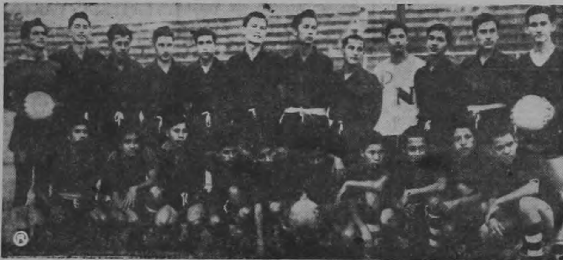
La Selección Juvenil de El Salvador se enfrenta esta noche a la de Guatemala a las ocho de la noche, en el tercer partido del II Campeonato Centroamericano y del Caribe de Futbol Juvenil. Por jugar en su propio terreno están considerados como candidatos para la conquista del título del Circuito.